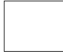
Huella Indice Derecho

Al Señor Director de la Marina Mercante PIDO: Admitir la presente solicitud y previo los trámites corespondientes acceder a lo antes solicitado, para lo cual fundo la presente en los artículos 31 y 83 de la Ley Orgánica de la Marina Mercante, el Convenio Internacional STCW 78 en su forma enmendada del cual Honduras forma parte.